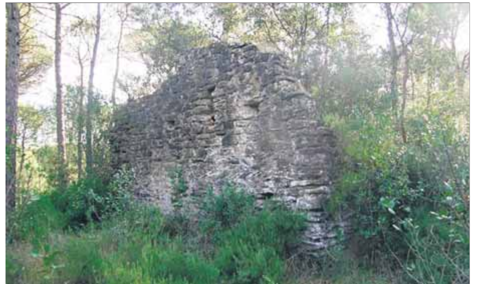
L'única paret visible de la torre de Sant Sebastià, al nord del conjunt